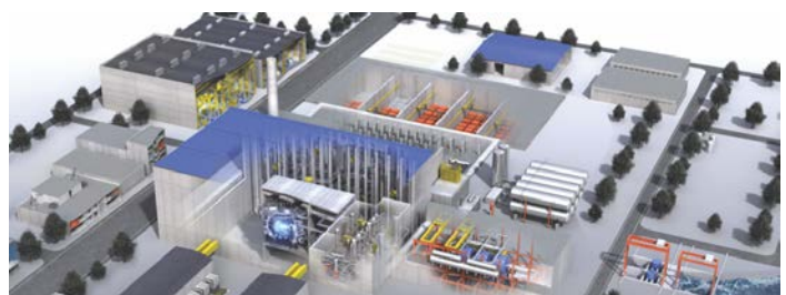
図 2 核融合原型炉プラントの全体像