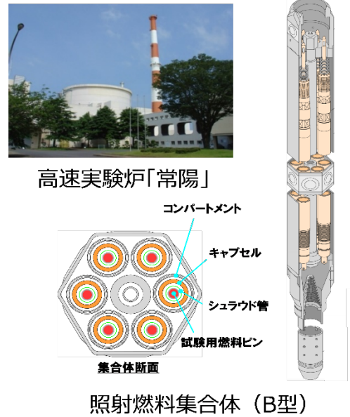
図1 高速実験炉「常陽」と照射燃料集合体例

減期核種を含むネプツニウム、アメリシウム、キュリウム、マイナーアクチノイド(MA)及びプルトニウム(Pu)-240等の偶数核のPu同位体核種に対しても高い核分裂断面積を有する。原子力利用の課題である高レベル放射性廃棄物の減容化・有害度の低減を目指し、MAを高速炉で消滅させるためのMA含有MOX燃料の開発を進めており、実際に高速実験炉「常陽」の使用済燃料から回収された数グラムのMAを原料とした燃料を用いた照射試験を運転再開後の「常陽」で実施することを計画している。また、今後、プルサーマルの進展に伴って使用済MOX燃料を再処理した場合に回収される高次化(同位体組成としてPu-240等の割合が高い)したPuの利用が課題となる。高速炉サイクルでは高次化Puを繰り返して利用して燃焼させることも可能であり、これを実現するため、従来の限度としてきたPu含有率約30wt%を超える高Pu含有MOX燃料の開発も目指している。これらの新しい燃料・材料の開発において、原子炉内での中性子による照射損傷、核分裂生成物の形成に伴う物性変化、照射挙動を正確にシミュレーションすることが重要であり、近年の計算科学の進展を活用して機構論的な物性モデル等を導入した燃料挙動解析コード等の開発を進めている。また、実用化の最終段階となる規制当局による安全審査においては、極めて高い信頼性が求められることから原子炉内での照射実績で燃料・材料の健全性を実証することが不可欠となっている。ここで、「常陽」はOECD諸国では唯一の高速中性子照射場であり、図1に示すように多様な形態での燃料ピン及び材料試験品の照射試験が可能である。2050年カーボンニュートラルに伴うグリーン成長戦略の実行計画(令和3年6月決定)でも謳われているように民間イノベーションを生かした多様な高速炉技術の絞り込み・重点化において「常陽」での照射試験による検証が不可欠とされている。このように、「常陽」等の中性子照射に係る研究開発インフラを早期に確保して、MOX燃料の照射試験の再開が望まれる。